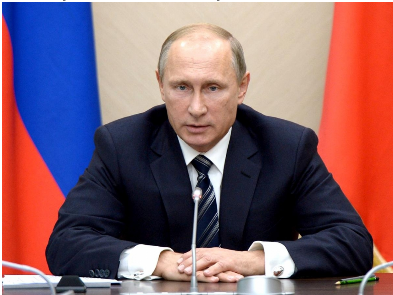
Путин Владимир Владимирович

Педагог: Президент России – это глава государства, который избирается народом на 6 лет. Он руководит нашей страной, её политикой, ведёт международные переговоры от имени России, подписывает договора и законы, является Верховным главнокомандующим Вооруженных сил - Российской Федерации. Слово «президент» в переводе с латинского обозначает «сидящий впереди, во главе». Президент России – это глава нашего государства, который избирается в соответствии с Конституцией Российской Федерации, в которой оговариваются его права и обязанности. В статье 81 о том, что «президентом Российской Федерации может быть избран гражданин Российской Федерации не моложе 35 лет, постоянно проживающий в Российской Федерации не менее 10 лет».